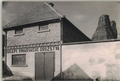
Snímek z počátku 30. let zachycující nově upravený sklep č. 31 (dnes ulice K. Čapka západně od židovského hřbitova), který družstvo zakoupilo spolu s pálenicí č. 32 v roce 1931 od Leopolda Skály.