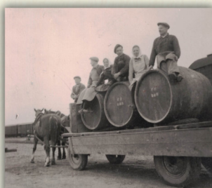
Nakládka vína na bzeneckém nádraží v červenci 1940.