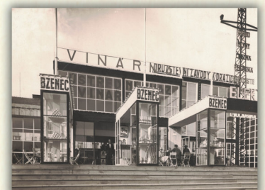
Výstava v Mladé Boleslavi, která trvala od 16. června do 31. srpna 1927.