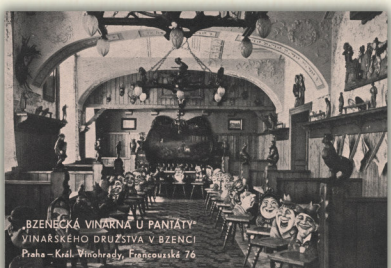
Bzenecká vinárna U PANTÁTY na ulici Francouzská v Praze.