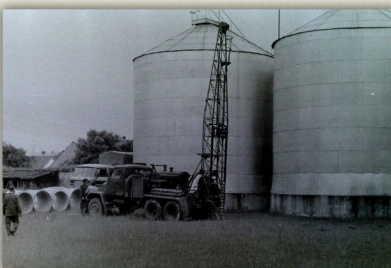
V roce 1975 zahájily tehdejší Vinařské závody v areálu bývalého zámeckého hospodářského dvora stavbu velkých skladovacích nádrží, která byla dokončena v roce 1978.