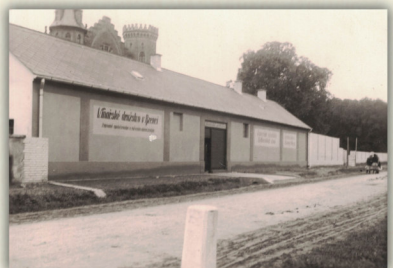
Dnes již neexistující budova prodejny se skladištěm a bednárny postavené v roce 1939 vedle zámku při ulici Těmická.