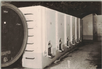
Pohled na kvasné kádě ve sklepech Vinařského družstva v zámku - snímek z roku 1947.

BZENEC, s. p.“, který byl zahrnut do první vlny kuponové privatizace a od 1. 5. 1992 pak akciovou společností. V roce 1998 odkoupilo tuto společnost, VINIUM Velké Pavlovice“, které posléze přesunulo veškerou výrobu do Velkých Pavlovic. V listopadu roku 2002 odkoupilo historickou část zámku spolu se sklady, stáčecí linkou, reprezentačním sklepem, parkem a kotelnou město Bzenec. Nově vystavěnou část bývalého závodu pak firma „PARADISO“ a objekt údržby firma „MANTECH“. V roce 2007 zakoupily prostory vinařství „Moravské vinařské závody Hukvaldy“ a od města si pronajaly sklepní prostory pod zámek a sektárnu. Později sem přesunuly své sídlo a v roce 2010 upravily název společnosti na „Zámecké vinařství Bzenec“, které se tak stalo nositelem tradice původního „Vinařského družstva v Bzenci“.