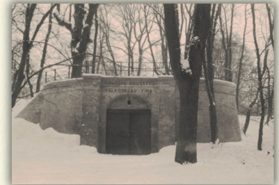
Vstup do družstevních sklepů v zámeckém parku na snímku z ledna 1939.